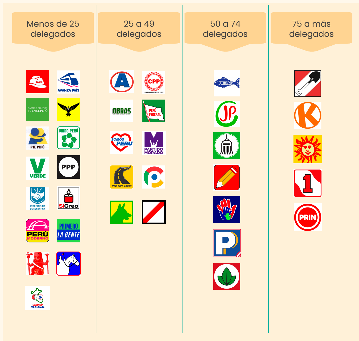
Gráfico 2. Cantidad de delegados por organización política para elecciones primarias, según rangos, en el marco de las Elecciones Generales 2026 4 .