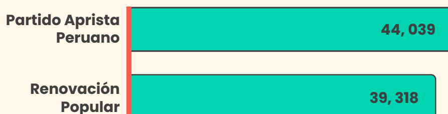
Gráfico 3. Cantidad de afiliados por organización política para elecciones primarias en la modalidad cerrada, en el marco de las Elecciones Generales 2026

Fuente: JNE (2025). Elaborado por Observatorio para la Gobernabilidad – INFOgob – JNE