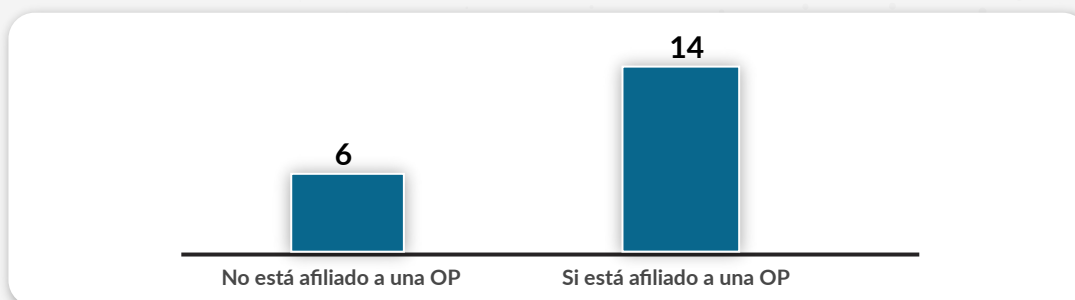
Gráfico 3: Cantidad de autoridades en consulta, según afiliación a organización política