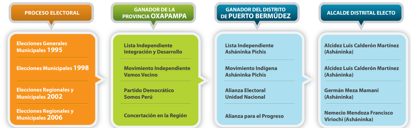
REGIÓN PASCO: ORGANIZACIONES POLÍTICAS GANADORAS EN LA PROVINCIA DE OXAPAMPA Y EN EL DISTRITO DE PUERTO BERMÚDEZ 1995-2006.

partidos políticos por consolidar alianzas con sectores de los Asháninka, cuya participación es tan influyente en la orientación mayoritaria de voto en esta localidad, que ha producido la disparidad de los resultados provinciales y distritales, de manera que las organizaciones políticas ganadoras en la provincia de Oxapampa quedaron relegadas a los segundos lugares de las preferencias electorales distritales en Puerto Bermúdez.